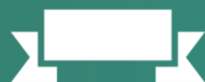
FAIXAS DE ARENA