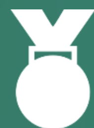
MEDALHAS COM FITAS PERSONALIZADAS

ALTA VISIBILIDADE PARA O PÚBLICO NO ESTÁDIO