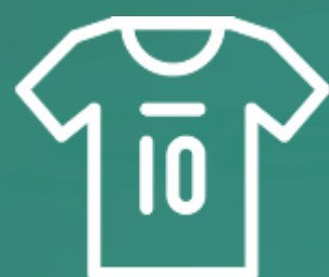
MARCAS NOS UNIFORMES