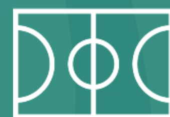
ESPAÇO PARA AÇÃO NO INTERVALO

VISUALIZAÇÃO DE MARCA NA TRANSMISSÃO AO VIVO