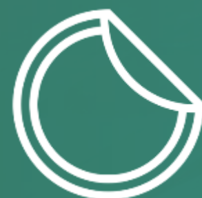
ADESIVO DE CHÃO