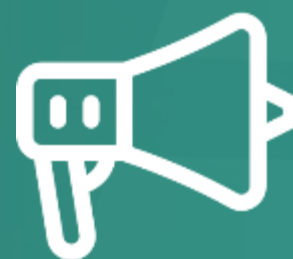
MENÇÃO DA MARCA NA LOCUÇÃO